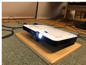
プロジェクター エプソン EB-1785W