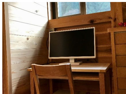
23.8型ワイド 液晶モニター

自立式床置き型スクリーン ＜スクリーンをテーブルに置く例＞ ※薪ストーブを使用しない時期