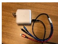
Anker USB 急速充電器と コード3種