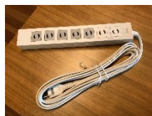
電源タップ 7個口 5m