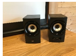
ハイパワーUSBスピーカー

※使用中は熱を発するため、直置きせず、お部屋にあるトレーを裏返してご利用ください。